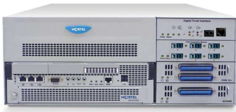
Figure 1. Business Communications Manager 450

Réduisez de 30 % les dépenses liées à vos conférences en éliminant vos besoins en services externes grâce à Meet-Me Conferencing 4 . Grâce à l'extension CEC, une entreprise peut